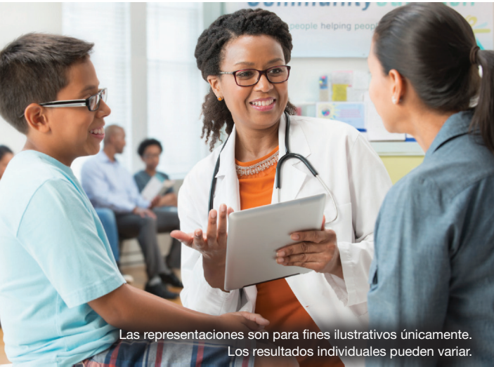
Las representaciones son para fines ilustrativos únicamente. Los resultados individuales pueden variar.

*Los Administradores de Educación Clínica (AEC) son empleados de Genentech y no brindan consejo médico. Para obtener consejo médico, consulte a su médico.