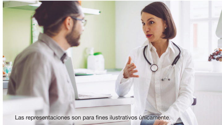
Las representaciones son para fines ilustrativos únicamente.

Los alergistas realizan pruebas específicas para detectar alergias alimentarias, como una prueba de punción o un análisis de sangre. Si se confirma el diagnóstico, el alergista le enseñará a usted o a su hijo estrategias para sobrellevar la alergia alimentaria y podría recomendarle un tratamiento.